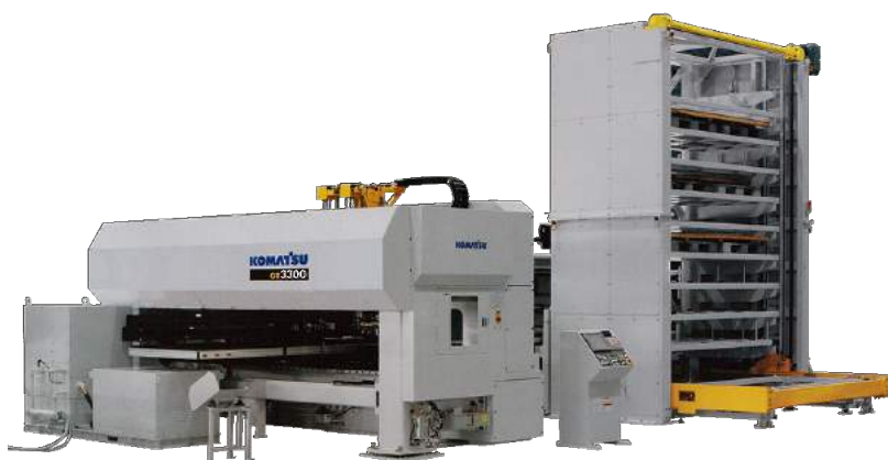
ガトリングプレスセンター GT 3300